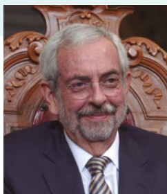
Dr. Enrique Graue Wiechers RECTOR